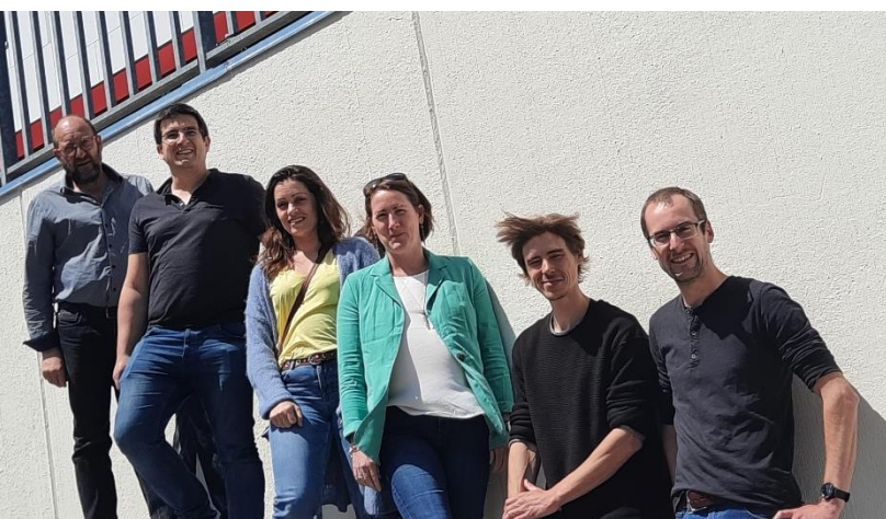
Première promotion Alter' Venture Normandie

Caen – le 9 septembre 2023 | L'accélérateur de croissance des entreprises de l'ESS Alter' Venture a été lancé en Normandie, en mai dernier. Né dans le Languedoc-Roussillon en 2017, puis dupliqué en Midi-Pyrénées et en Bretagne, ce dispositif inédit et innovant est désormais déployé en Normandie. Le programme d'accélération, conçu pour un accompagnement sur 8 mois, s'adresse aux entreprises de l'Économie Sociale et Solidaire qui souhaitent se développer en accord avec leurs valeurs, dans une optique de croissance maîtrisée et de développement durable de l'emploi au cœur de leurs territoires. Le programme est co-financé par la région Normandie et le fonds européen de développement régional (FEDER)